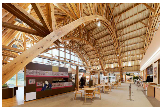
林野庁長官賞 道の駅ふたつ（秋田県）

いる。火災時はプラスチックのイスの方が燃焼の広がりが高く、木のイスは燃焼の広がりが遅いことも実験で確認した。」と紹介した。